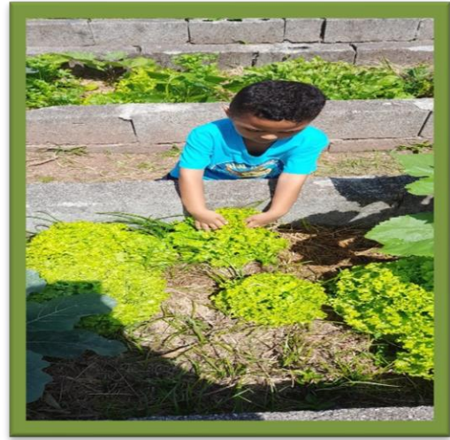
Oficinas sobre o processo da Colheita