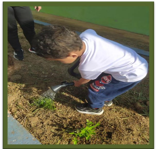
Oficina de plantio crianças creche Av. Brasil