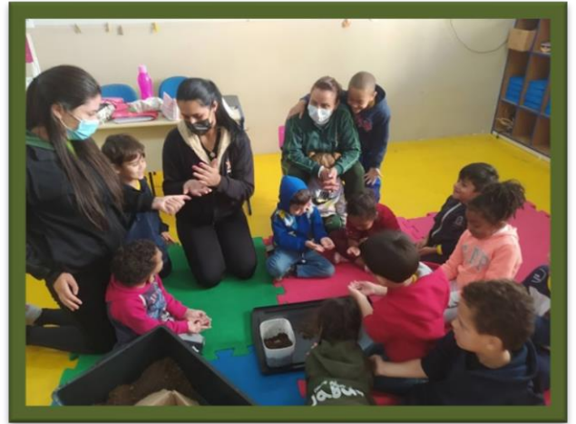
Oficinas sobre o processo da compostagem e minhocário