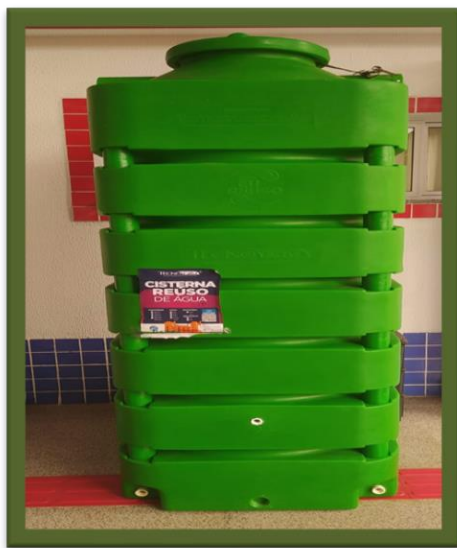
Cisterna para reuso de água