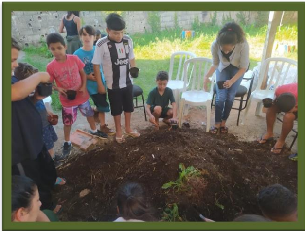
Oficina de plantio crianças projeto-Prema

5. Iniciamos as etapas do 3º ciclo, que embora estivesse previsto para seu início no segundo trimestre, foi possível adiantar o processo. Em este ciclo as crianças, adolescentes e colaboradores da instituição experienciaram todas as etapas do plantio. Da preparação da terra, ao plantio das mudas e os passos necessários para a manutenção da vida que foi colocada no solo. Em este ciclo também foram discutidos temas como agroecologia e alimentação saudável.