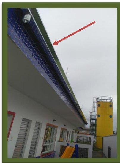
Instalação de calha para captação de água