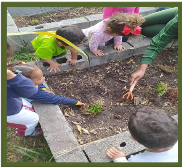
Oficina de plantio crianças creche Jundiapéba