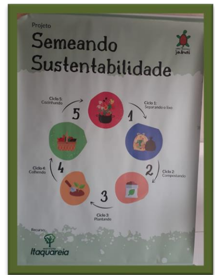
Banner exposto nas unidades