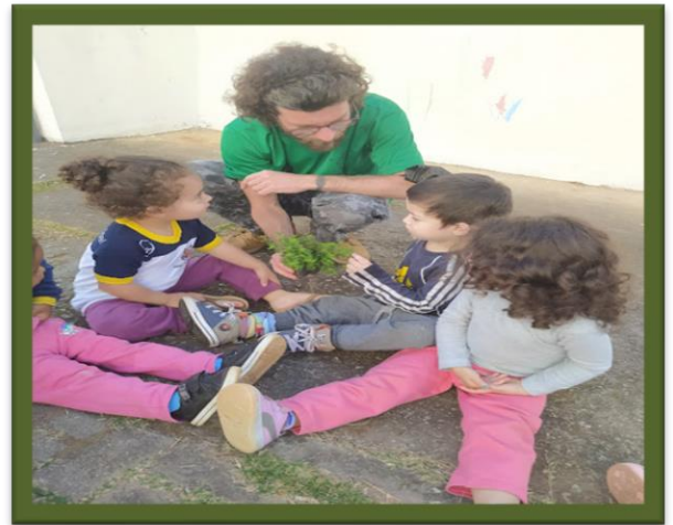
Oficina de plantio crianças creche Mogi-moderno